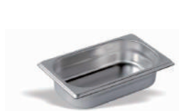
Bac GN < 24 GN 1/1 et GN 2/1