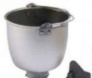
Cuve 2 max