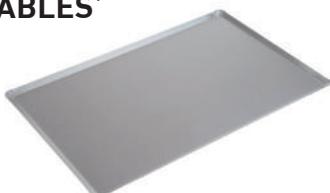
Plaque pâtissière 800 x 600 < 24 plaques