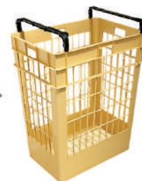
Paniers à pains

* données indicatives pour bacs GN de 20mm de profondeur et cuves de 40l - variables selon la profondeur ou la géométrie du supports à laver.