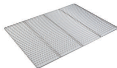
Grille max 600 x 400 < 10 grilles

* données indicatives pour bacs GN de 20mm de profondeur et cuves de 40l - variables selon la profondeur ou la géométrie du supports à laver.