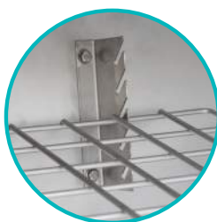
Réglez la hauteur des grilles