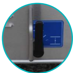
Protection de poignée de vidange