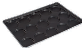
Plaques pains spéciaux